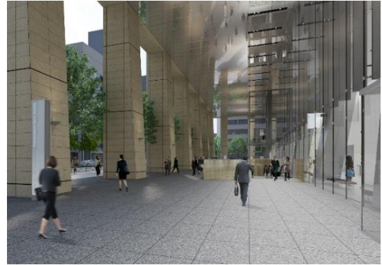
外観・断面イメージ